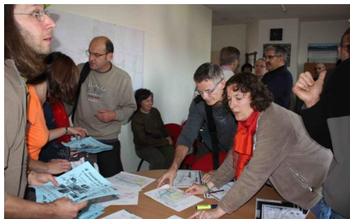
Dimanche matin, les membres des associations opposantes ont sillonné Walbourg, Biblisheim et Durrenbach pour distribuer des tracts rappelant à la population qu'elle « doit absolument donner son avis à l'occasion de l'enquête publique ».

Lors d'une première enquête publique, en mai-juin 2009 à propos de l'extension des activités de la société Transmétaux qui venait de quitter Mertzwiller où elle était à l'étroit pour s'installer à Biblisheim, les associations Villages Paisibles et Sauer Nature de Walbourg avaient réussi à mobiliser les citoyens et politiques des environs (DNA du 26 juin 2009). Elles ont obtenu gain de cause quand le préfet a donné un avis négatif — les conseils municipaux des communes concernées (Biblisheim, Walbourg, Durrenbach, Gunstett et Haguenau) s'étaient prononcés contre le projet, de même que le président du conseil général du Bas-Rhin Guy-Dominique Kennel et le député Frédéric Reiss — mais savaient qu'il faudrait rester vigilant. Depuis mardi dernier et jusqu'au 12 octobre, une nouvelle enquête