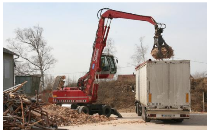
La société Transmétaux, spécialisée dans la collecte et le tri des déchets d'entreprises et de collectivités, s'est installée en 2009 sur une ancienne friche industrielle d'un peu plus de sept hectares à la sortie de Biblisheim en direction de Walbourg.

déposé une nouvelle demande en vue d'obtenir du préfet l'autorisation d'exploitation et d'extension de son site de Biblisheim (*). À Biblisheim comme à Walbourg,