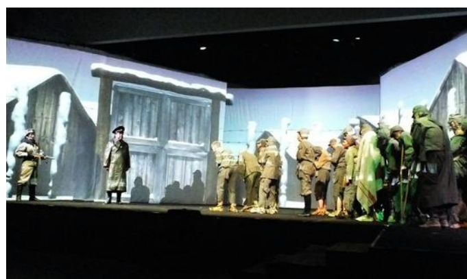
Une des scènes émouvantes : l'arrivée des prisonniers alsaciens devant le camp de Tambow.

Les premières représentations de Tambow, l'enfer rouge qui ont eu lieu jeudi, vendredi et samedi à La Scène de Pfaffenhoffen ont reçu les ovations du public.